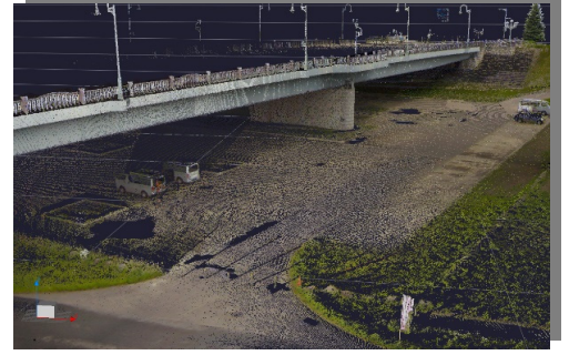
地形測量（地上レーザスキャナ）